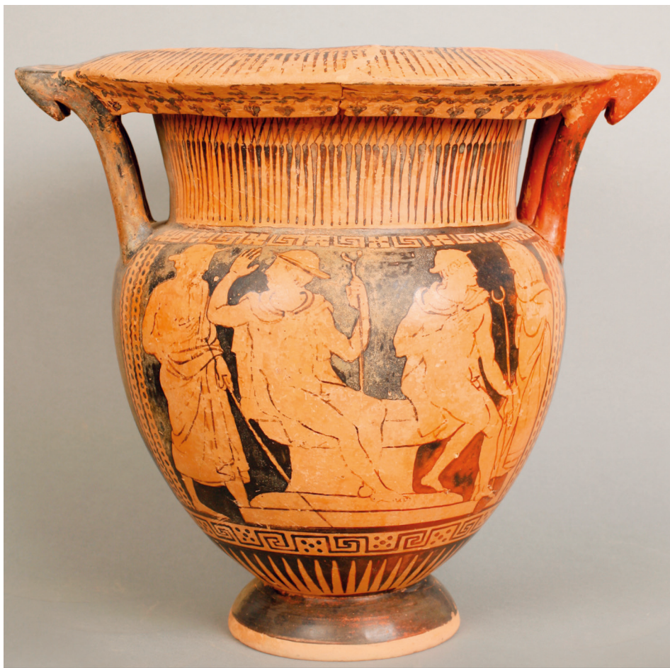
Fig. 4 : Cratère à colonnettes étrusque à figures rouges, attribué au Groupe de Bologne 824 (F. Gilotta) ou proche du Groupe de Vagnonville (M. Scarrone), vers 430-410 av. J.-C., provenant probablement de Foiano della Chiana, No inv. 25.30.94, Ht. 38,5 cm ; diam. emb. 35,6 cm (40,5 cm avec les anses), Firenze, Museo Archeologico Nazionale, inv. 25.30.94.