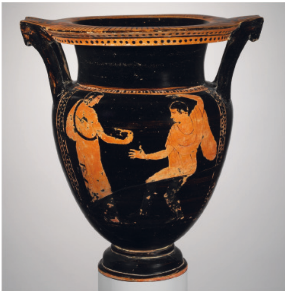
Fig. 5 : Cratère à colonnettes étrusque décoré en peinture superposée, attribué au Groupe de Vagnonville, au Peintre d'Athènes (?), 440-420 av. J.-C., No inv. 92-9.29, New York, Metropolitan Museum 96.9.29. Domaine public.