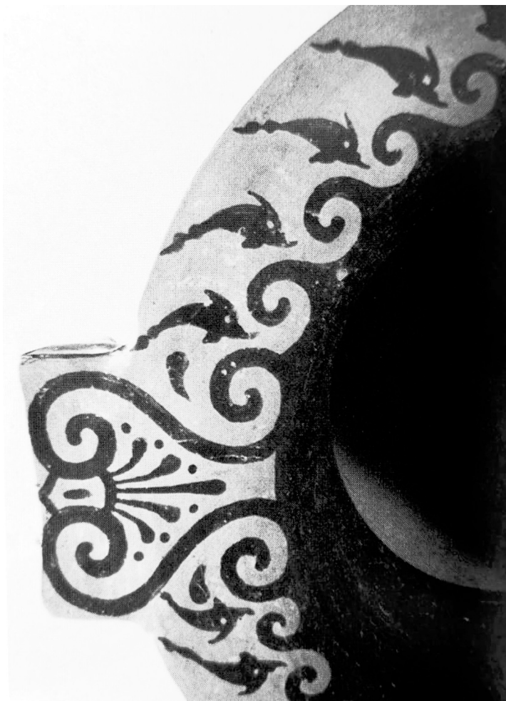
Fig. 2 : Détail du décor de l'embouchure du cratère à colonnettes étrusque à figures rouges, lié à l'atelier du Peintre de Bologne 824, vers 420-400 av. J.-C., No inv. 3842, Copenhague, Nationalmuseet. D'après Scarrone 2015, pl. 54.d.