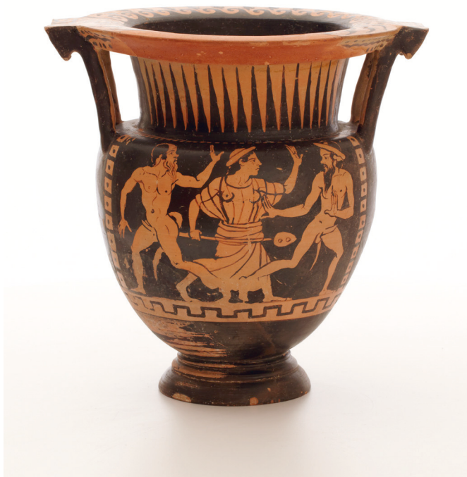
Fig. 1b : Cratère à colonnettes étrusque à figures rouges, lié à l'atelier du Peintre de Bologne 824, vers 420-400 av. J.-C., acquis à Florence en 1891 auprès de G. Paccini, No inv. 3842, Ht. 40 cm ; diam. emb. 34,1 cm (40,2 cm avec les anses), Copenhague, Nationalmuseet, Photo : Nora Petersen. © National Museum of Denmark.