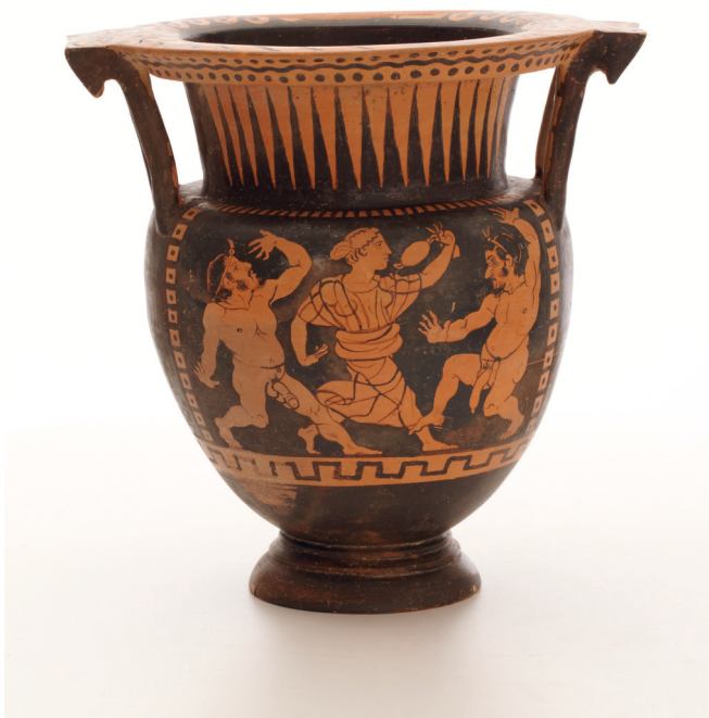
Fig. 1a : Cratère à colonnettes étrusque à figures rouges, lié à l'atelier du Peintre de Bologne 824, vers 420-400 av. J.-C., acquis à Florence en 1891 auprès de G. Paccini, No inv. 3842, Ht. 40 cm ; diam. emb. 34,1 cm (40,2 cm avec les anses), Copenhague, Nationalmuseet