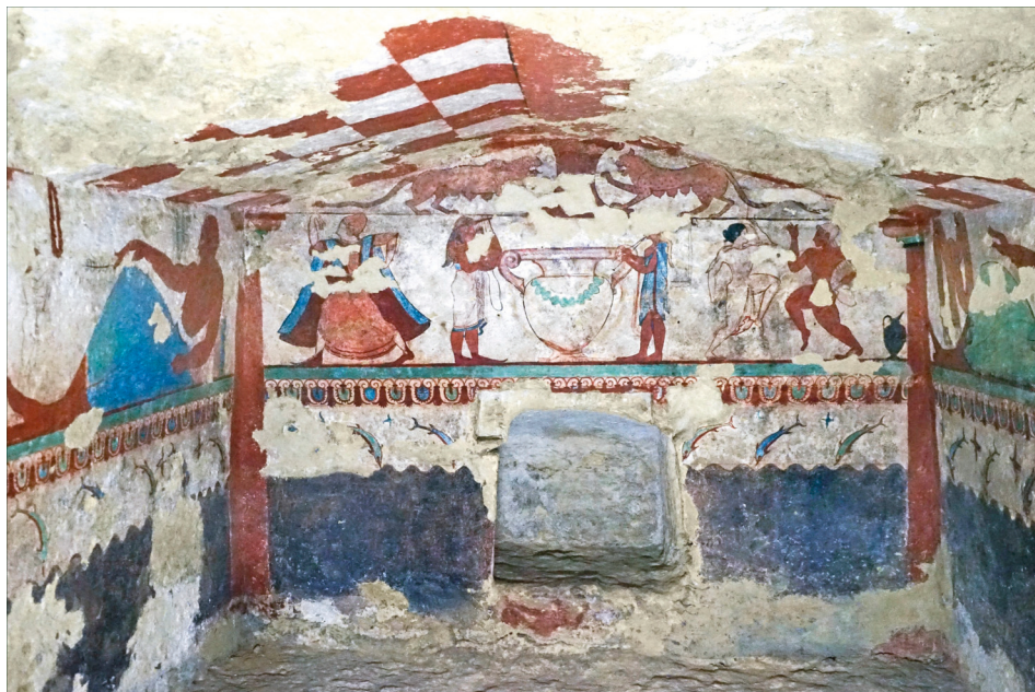
Fig. 6 : « Tombes des Lionnes », peinture murale, L 3,80 × l 2,91 × H 2,10 m, Tarquinia, vers 520 av. J. C.