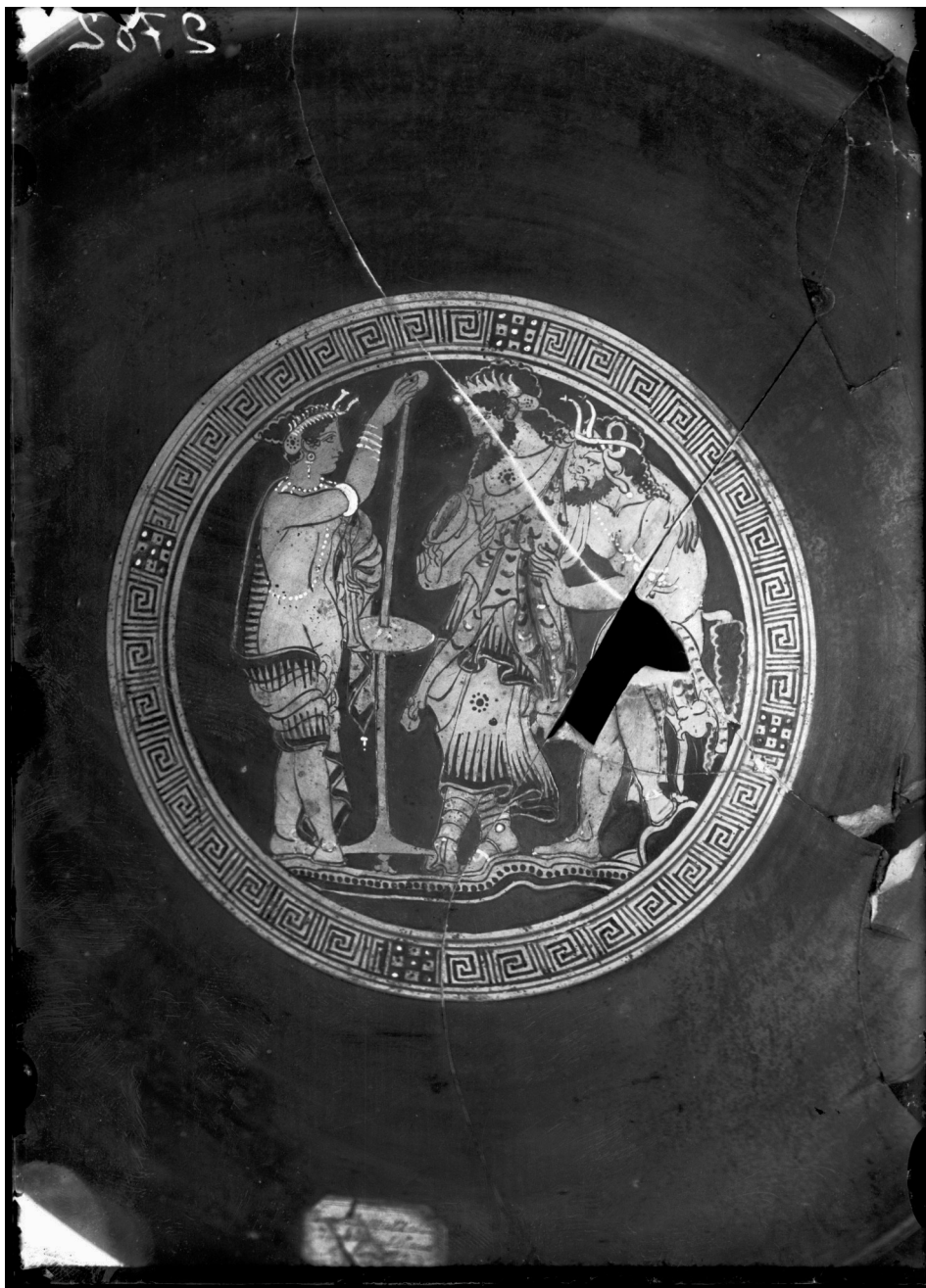
Fig. 3 : Coupe étrusque à figures rouges attribuée au Groupe Clusium (Beazley), provenant de la Tombe Mazzetti de Montepulciano, vers 340-330 av. J.-C., No inv. 7824, Firenze, Museo Archeologico Nazionale.