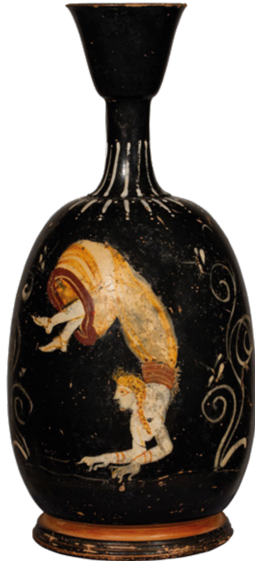
Fig. 1 : Lécythe aryballisque à figures rouges, style de « Gnathia » (cat. 115) 330-320 av. J.-C. Tarente, Museo Archeologico Nazionale di Taranto, inv. 143496

Désignés par une multitude de termes grecs et latins, notamment sous la dénomination