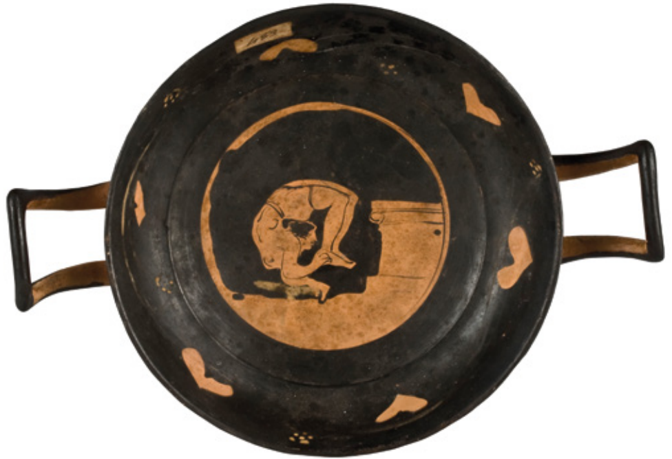
Fig. 4 : Médaillon de coupe italiote à figures rouges, acrobate devant un autel (cat. 137). IV e siècle av. J.-C. Ruvo di Puglia, Museo Nazionale Jatta, inv. MJ 35265

l'admiration de la foule, pour de l'argent, en associant une prouesse contre-nature, qui force le corps hors de ses limites naturelles. Le développement de mouvements contrariés éloignés de la mobilité quotidienne qu'incarne parfaitement la posture renversée de l'acrobate, à contre-pied de la normalité, participe à son échelle à la construction d'une altérité visuelle.