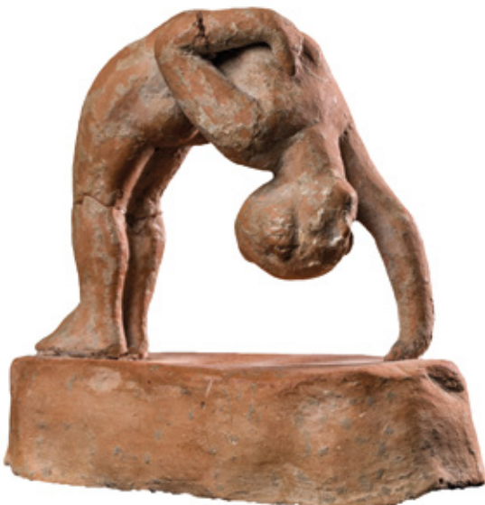
Fig. 3 : Figurine d'acrobate faisant le pont inversé (cat. 131) Fin IV e siècle av. J.-C. Tarente, Museo Archeologico Nazionale di Taranto, inv. 50323