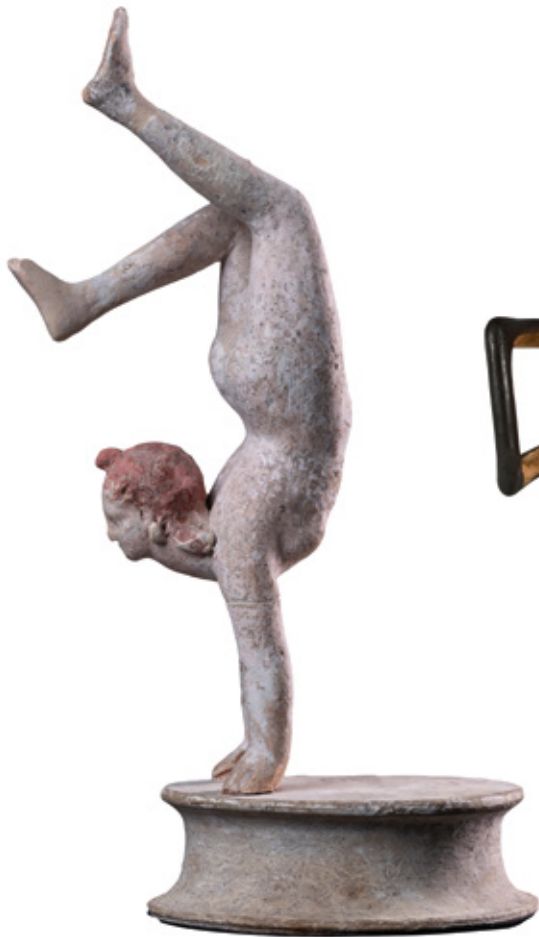
Fig. 2 : Figurine d'acrobate sur les mains (cat. 110) Fin IV e siècle av. J.-C. Tarente, Museo Archeologico Nazionale di Taranto, inv. 4059