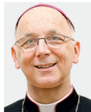
Marian Eleganti (Jg. 1955) ist Weihbischof des Bistums Chur und in der Schweizer Bischofskonferenz hauptverantwortlich für das Gesundheitswesen.