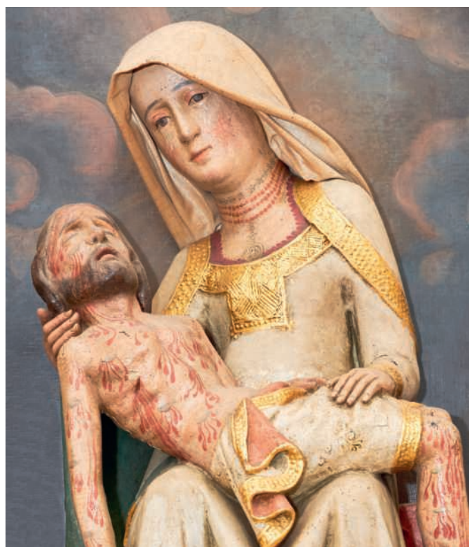
Die gotische Pietà in der Sonnenhalbkapelle.