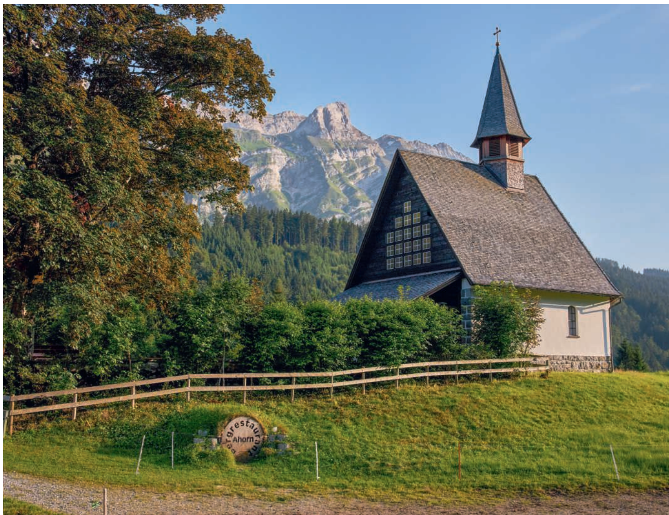
Die Ahornkapelle, im Hintergrund der Öhrlikopf am Säntismassiv.

Der Altar der Kapelle enthält barocke Elemente aus der Zeit von 1790 bis 1800. Er wurde somit in die grössere Kapelle übernommen. Die vielen brennenden Kerzen im Vorzeichen der Kapelle zeugen davon, dass viele Besucher hier jahrein und jahraus mit ihren Anliegen vorbeikommen. Etliche davon haben auf wunderbare Weise Erhörung gefunden. Dasselbe trifft auch auf die Ahornkapelle zu.