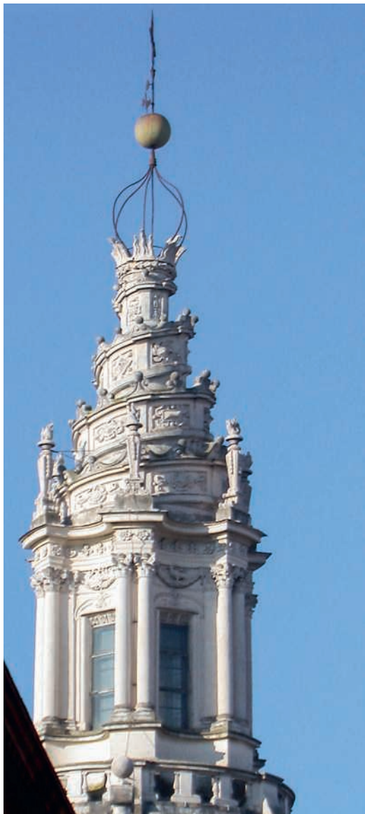
Kuppel von Sant'Ivo alla Sapienza in Rom (Francesco Borromini).