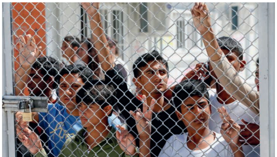
Menschen im überfüllten Flüchtlingslager Moria auf Lesbos.

Gleichzeitig zur Ankündigung der Schweiz, die 23 jungen Flüchtlinge aufzunehmen, habe Portugal 500 aufgenommen. Im Vergleich wirke die Aktion der Schweiz doch sehr bescheiden. (uab)