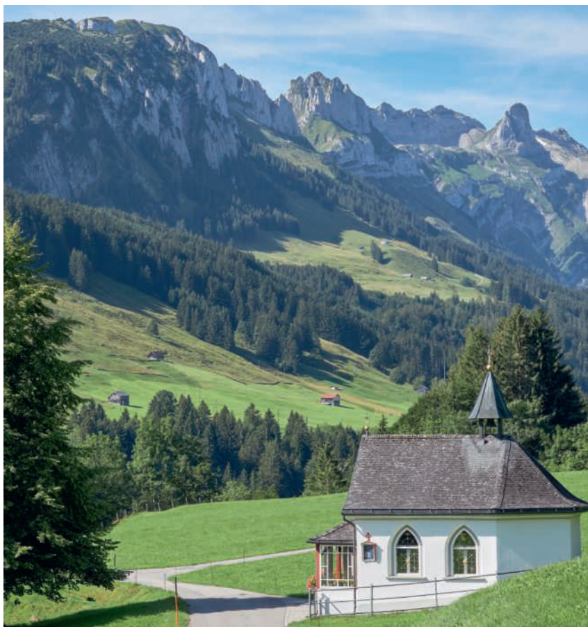
Die Kapelle Sieben Schmerzen Mariens in Sonnenhalb, Weissbad.

Die heutige Kapelle wurde im Jahr 1861 erbaut. Sie löste eine Kapelle aus dem Jahr 1796 ab, die zu klein geworden war. Ein Bauer hatte einen Bildstock versprochen, wenn beim Neubau von Haus und Scheune alles gut ginge. Und baute schliesslich eine Kapelle. Für ihre Innenausstattung erhielt er vom Kirchenpfleger die gotische Pietà, die im Jahr 1560 den Dorfbrand von Appenzell in der Kreuzkapelle unbeschadet überstanden hatte. Nach dem Historiker P. Rainald Fischer OFMCap wollte der Kirchenpfleger die Statue wegen ihres «unstättlichen Anblicks» beseitigen. Im Jahr 1829 kam die Kapelle zu einem Turm und einer Glocke. Ein Bauer hatte in einer Notlage versprochen, eine Glocke zu stiften. Auf dem Sterbebett wies er die Kinder an, das Versprechen zu halten und am Morgen und am Abend den «Engel des Herrn» zu läuten.