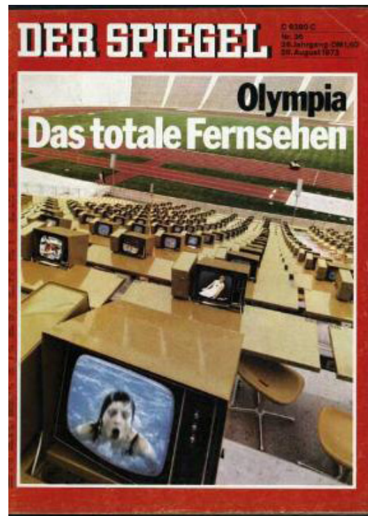
Abb. 1: Der Spiegel, Nr. 36, 1972

Fernsehgerät identifiziert. Die Schlagzeile unterstreicht, dass die Olympischen Spiele zu einem Fernsehereignis geworden sind: sie finden gewissermaßen für und durch die Fernsehübertragung statt.