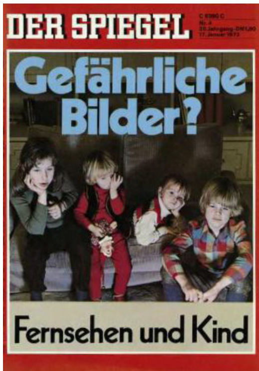
Abb. 2: Der Spiegel, Nr. 4, 1972

hens her. Die Kinder sehen ohne elterliche Aufsicht fern. Ihr Blick ist auf das Geschehen im Fernsehen gerichtet, aber in ihrem Gesicht liegt keine Begeisterung. Der Raum ist dunkel und wird lediglich vom nicht sichtbaren Fernsehgerät beleuchtet. Das mutmaßlich Jüngste der Kinder, dessen Kindlichkeit durch das Festhalten eines Kuscheltiers symbolisiert wird, zeigt mit seiner Handbewegung zu den Augen eine Geste starker Übermüdung. Impliziert wird also nächtliches Fernsehgucken, das pathologische Züge annimmt und die Kinder vom Schlaf abhält. Die sprachlich verkürzte Frage „Gefährliche Bilder?“ ist damit eine rhetorische Frage. Der Betrachter des Bildes sieht zwar nicht, was die Kinder sich anschauen. Er bekommt aber durch das nächtliche Fernsehen nahegelegt, dass es sich nicht um kindgerechte Inhalte handelt und dass sich die Fernsehnutzung schädlich auswirkt. Es handelt sich um einen dramatisierenden Aufmacher, der durch die Inhalte der Titel-