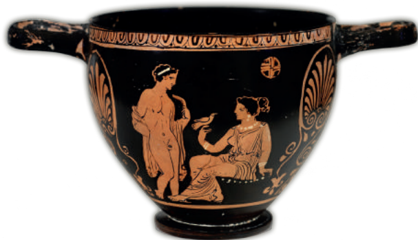
FIG. 1 a-b