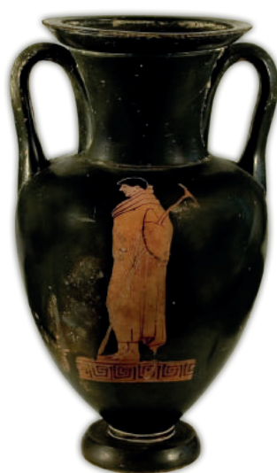
FIG. 3 a-b