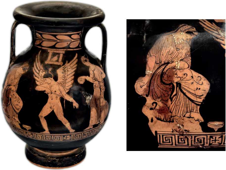
FIG. 8 A—B