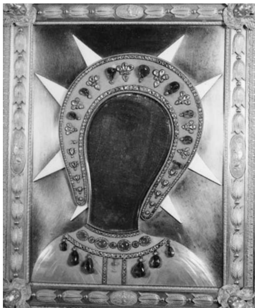
Fig. 3. Icona della Vergine del Fileremo, icona, sec. XIII (?). Cetinje (Montenegro), Museo nazionale.

icone di tradizione bizantina che si producevano, con un'intensità quasi industriale, nella città di Candia: non a caso il pellegrino Felix Fabri, nel 1480, ci testimonia di come fra i più apprezzati souvenirs della città cretese vi fossero le « imagines beatae Virginis, quas singulares quadam arte vivaciter depingunt secundum formam, qua S. Lucas dicitur depinxisse Virginis imaginem » 23 .