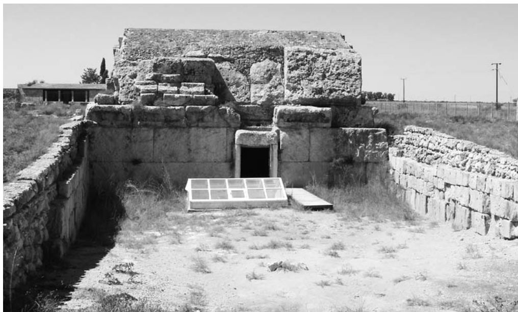
Fig. 6. Tomba cipro-arcaica nota come Prigione di santa Caterina , sec. VII a.C. Area della necropoli di Costanza, presso Famagosta (Cipro).