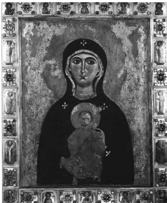
Fig. 2. Icona della Vergine "Nicopea", icona, sec. XII. Venezia, San Marco.

della Vergine (menzionata a partire dal tardo Trecento), che già verso il 1440 si vociferava essere opera dell'evangelista Luca. La nobilitazione anagrafica serviva plausibilmente ad esplicitare e dar ragione, agli occhi soprattutto dei pellegrini devoti, della vasta fama ottenuta da quest'anonima e improbabile immagine sacra, della cui sorte poco si sa: forse distrutta assieme alla chiesa durante le incursioni del Barbarossa nel 1537, fu probabilmente sostituita da un'altra sacra effigie al momento della ricostruzione dell'edificio ad opera dei Veneziani nel 1590, il cui aspetto ci è forse restituito da una pittura murale nella navata (fig. 1): si trattava in sostanza di un'effigie che riprendeva le caratteristiche iconografiche della più celebre icona venerata nella città lagunare, ossia la Nicopea di San Marco (fig. 2) 12 .