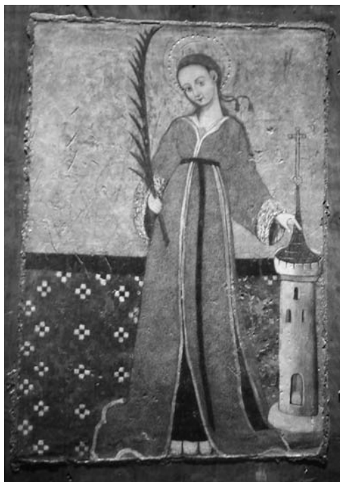
Fig. 4. Santa Barbara, tempera su tavola, inizi sec. XV. Il Cairo, Museo copto.

intitolata al Vecchio Cairo 28 e magari di deporvi un'immagine votiva, sul genere della tavola catalana di inizi Quattrocento oggi nel Museo copto (fig. 4) 29 , potevano abituarsi all'idea raccogliendosi davanti al suo braccio nella città lagunare 30 , alla sua testa nella cattedrale di Candia 31 o a un'antica colonna posta in una chiesa di Beirut, le cui venature purpuree si dicevano prodotte dal sangue colatovi sopra al momento della sua decapitazione 32 .