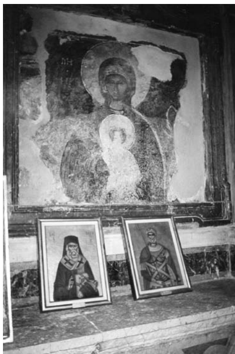
Fig. 1 Vergine Kassopitra , affresco, fine sec. XVI. Kassiopi (Corfù), santuario della Panagía Kassopítra.

Nel Mediterraneo orientale il “portolano sacro” comprendeva luoghi come il monastero rupestre della Vergine di Fraskiá, vicino a Candia, che costituiva un approdo sicuro in situazioni di pericolo 10 , l’isolotto di San Nicola, noto anche come Sazan o Saseno, all’imbocco del porto di Valona 11 o ancora la chiesa della Madonna di Kassiopi, a Corfù, situata in corrispondenza di una baia riparata dai venti nelle vicinanze del problematico stretto di Butrinto. Come apprendiamo dalle fonti a partire dalla metà del Trecento, i marinai e i pellegrini che si trovavano molto spesso