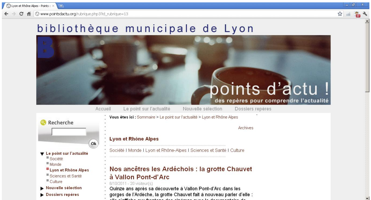
Illustration n°2 : Bibliothèque municipale de Lyon