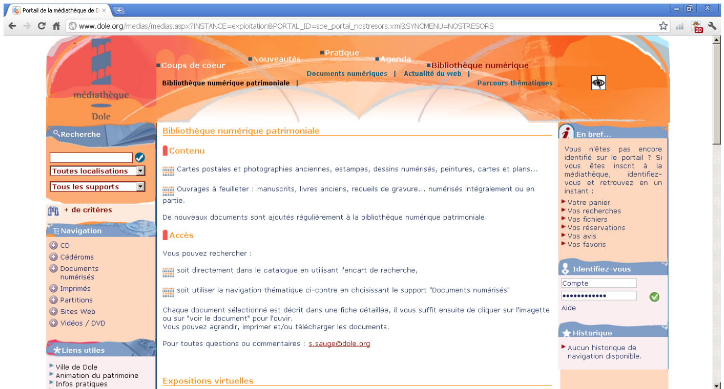
Illustration n°3 : Médiathèque de Dole