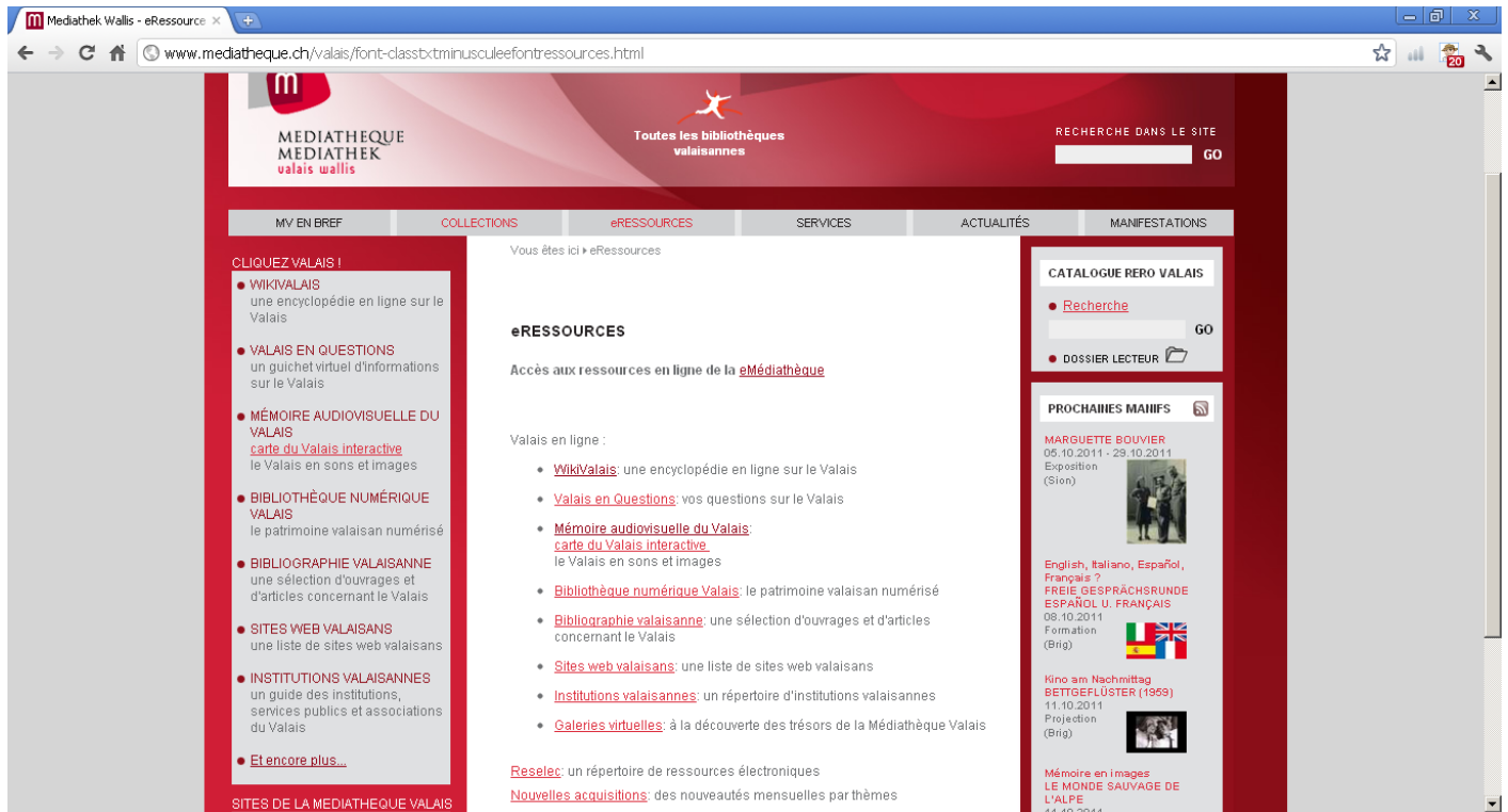
Illustration n°1 : Médiathèque du Valais