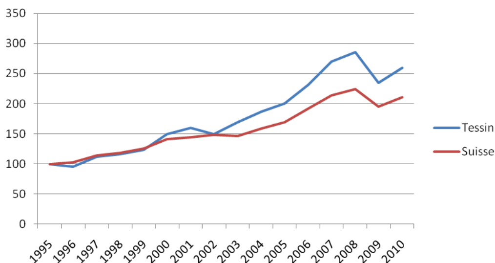
Figure n°2 : évolution indicielle des exportations tessinoises et suisses entre les années 1995 et 2010