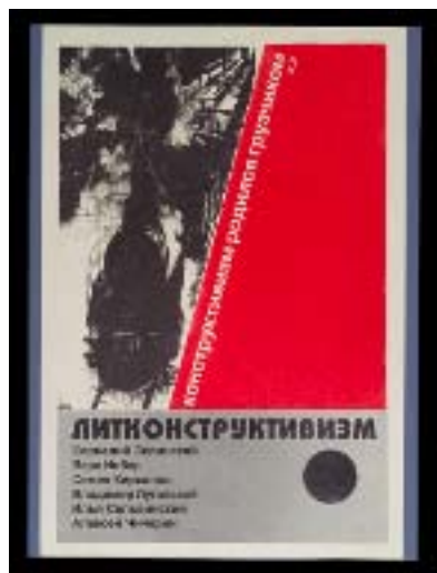
constructivisme littéraire, "boîte à livres", Mikhail Karasik (Russie, 1953) St. Petersburg, Kharmsizdat, 2002–2003, Research Library, The Getty Research Institute